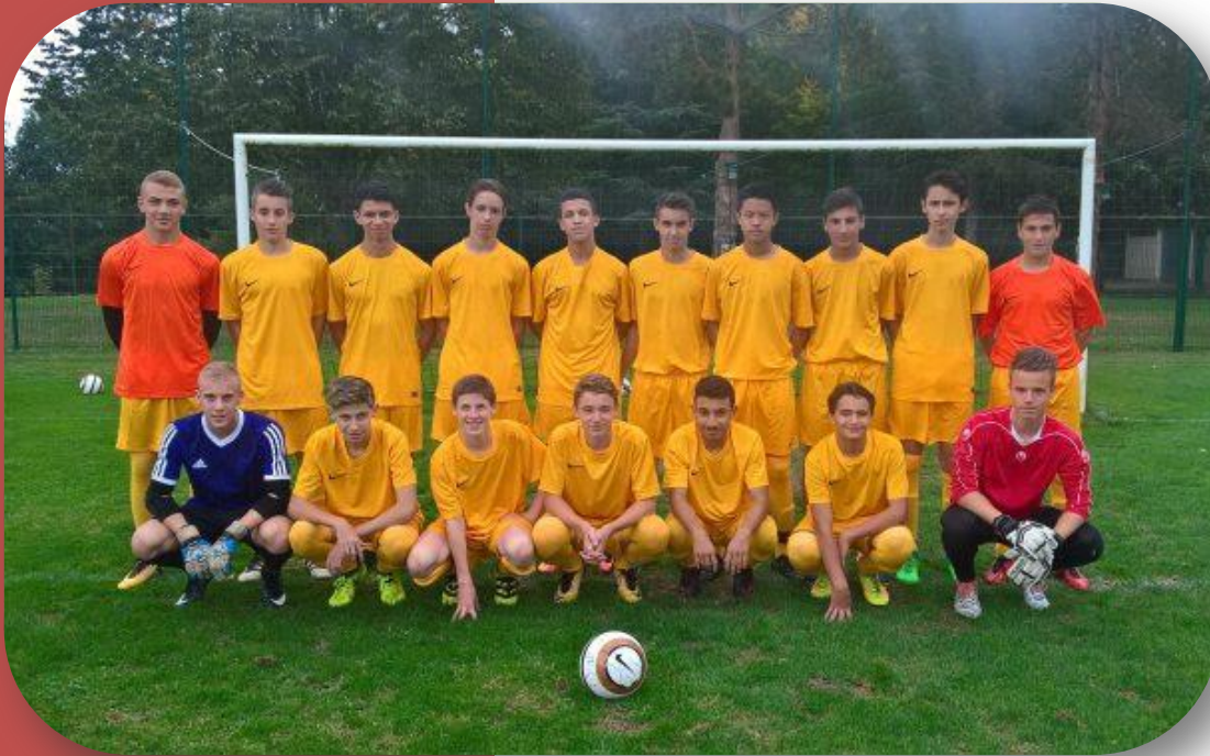
Groupe des élèves du dispositif à horaires aménagés FOOTBALL du Lycée Pardailhan

« La fréquentation d'une section sportive scolaire par un élève est pour lui un facteur d'équilibre, d'épanouissement, d'intégration et de réussite scolaire. »